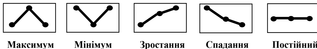
Рис. 2. Класи патернів запропонованої переставної ентропії при m = 3 .

При реалізації процедур оцінки ступеня хаотичності був внесений ряд удосконалень в традиційні методи. Зокрема, в інструментальній системі реалізований оригінальний обчислювальний алгоритм оцінки переставної ентропії за послідовними трійками значень x_{i-1} , x_i , x_{i+1} , i = 2, \dots, N - 1 часового ряду. Запропонований алгоритм автоматично відносить ці послідовності до одного з 5 класів патернів (рис. 2).